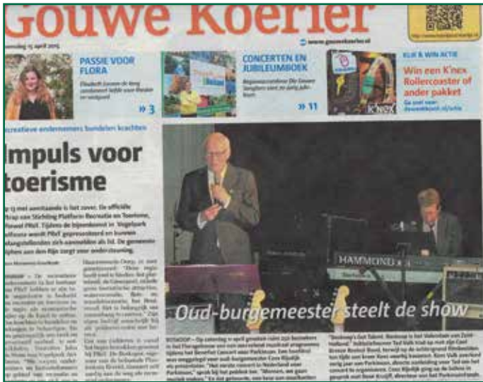
Het benefietconcert voor het ParkinsonFonds haalde zelfs de lokale krant.