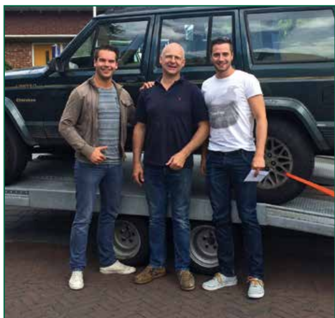
Team Tjerokie voor hun trouwe jeep die ze helemaal naar Dakar reed.