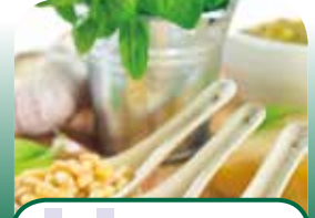
In 10 stappen naar meer smaak