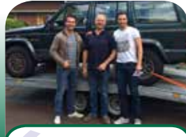
Zingen, wandelen, fietsen en racen voor Parkinson