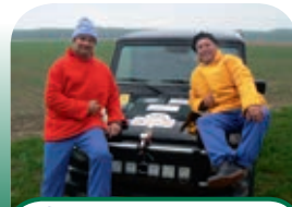
7 Team Buurman en Buurman reist naar de Noordkaap