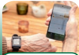
6 Update ParkinsonThuis studie