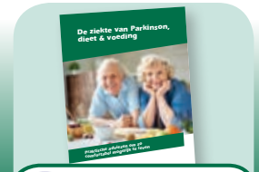
8 Brochure over voeding & dieet