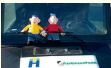
Buurman & buurman gingen mee!

“Op weg naar huis logeerden we nog twee nachten in Levi, Finland. We reden Huskyslee en hebben gesneeuwscooterd. Bij een temperatuur van -40! Dat is zelfs voor Lapse begrippen erg koud. Na die vrije dag hadden we weer een 24-uurs etappe, van Levi naar Lübeck, Duitsland. Daar genoten we van een heerlijk afscheidsdiner. We zijn in de toerklasse op de 10de plek geëindigd!”