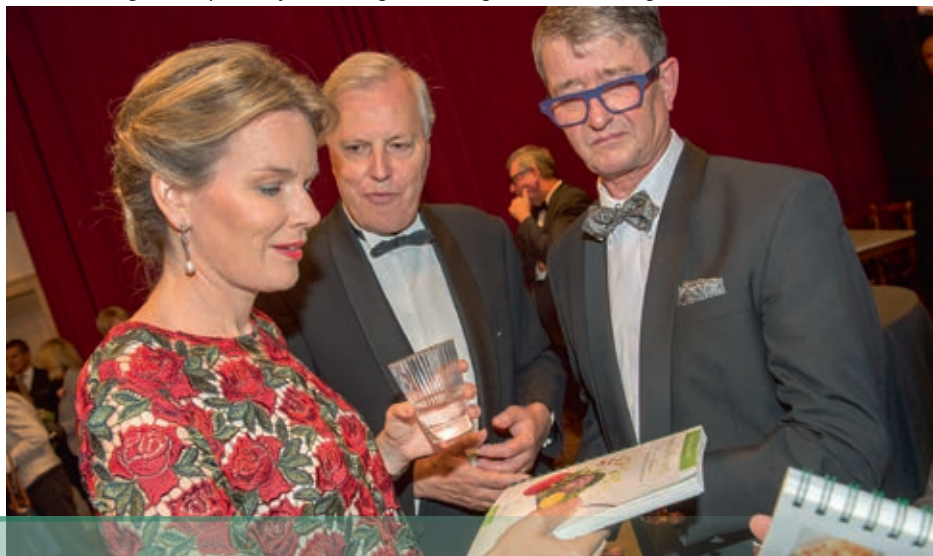
De eerste kookgids werd persoonlijk overhandigd aan koningin Mathilde van België.

Smaak is mijn passie en less is more: het gaat om de zuiverheid van combinaties."